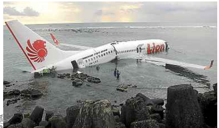
L'appareil a manqué la piste d'atterrissage et fini sa course dans la mer.

seulement quatre ont été hospitalisées, a-t-on appris de sources médicales. Livré en mars, l'appareil flambant neuf venait de Bandung, dans la province de Java occidentale, et s'apprêtait à atterrir à l'aéroport de Denpasar. Les causes de l'accident n'ont pas encore été déterminées. La compagnie Lion Air est placée depuis 2007 sur une liste noire de l'Union européenne, faute de répondre à des normes de sécurité suffisantes. ■