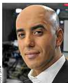
Redoine Faïd en 2010.