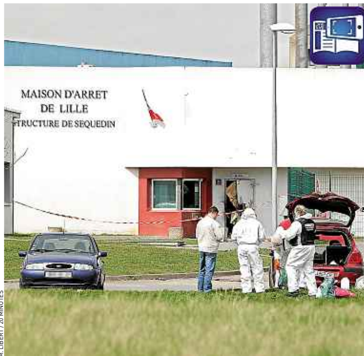
Samedi, le fugitif a fait sauter la porte de la prison à l'aide d'explosifs.

Selon la CGT, cette évasion a été « minutieusement préparée » et Redoine Faïd a bénéficié de complices « qui l'atten-