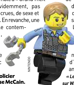
Le policier Chase McCain.

risation, les Lego s'aventurent dans un terrain complètement inédit. Enfin... Pas tout à fait, puisque « Lego City Undercover » ressemble à « Grand Theft Auto ». Evidemment, pas d'histoires crues, de sexe et de violence. En revanche, une mégalopole contemporaine, Lego City. Le joueur devient le superflic