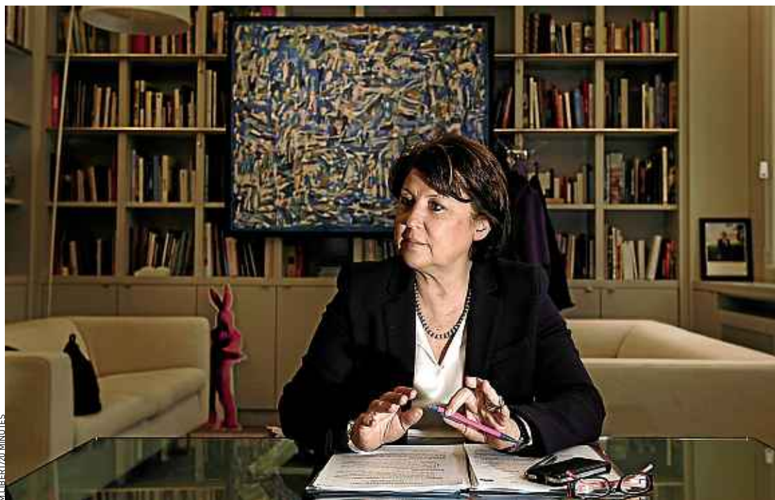
La maire de Lille, Martine Aubry, part très grande favorite pour conquérir une nouvelle fois l'hôtel de ville.

pour Martine Aubry, qui doit encore convaincre les Lillois que cette ascension profite à tous, alors que le taux de chômage de l'agglomération, à 11,3 %, reste supérieur à la moyenne française. Mais du point de vue politique, la maire a plutôt des problèmes de riche, comme continuer à rassembler autour d'elle les composantes parfois remuantes de sa majorité PS, Verts, PCF et MoDem. ■