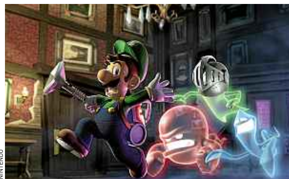
Luigi, frère de Mario, traque les fantômes. Ou le contraire ?

► A la poursuite des gangsters avec Chase McCain. Après s'être accaparés une foule d'univers (« Batman », « Indiana Jones », « Star Wars »...) et les avoir gentiment tournés en dé-