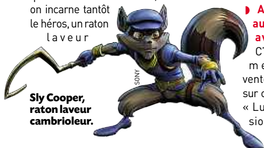
Sly Cooper, raton laveur cambrioleur.

► A la quête du butin avec Sly Cooper. « Sly Cooper », né en 2002 sur PlayStation 2, continue de dérober des trésors, de se faufiler sur les toits et d'escalader les murs et parois. Dans « Sly Cooper : Voleurs à travers le temps », le quatrième de la série, on incarne tantôt le héros, un raton laveur