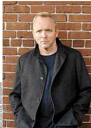
L'écrivain est aussi l'un des auteurs de la série « The Wire ».

Nourrissant trafics et corruptions en tous genre, la Prohibition cimentera toute une culture : le roman noir, et le cinéma de même ton, de William Burnett avec son Petit César ou Dashiell Hammett et sa Moisson rouge (1929 tous les deux) à Matt Bondurant et ses Quelques gouttes d'alcool (2010, adapté au cinéma en 2012 par John Hillcoat et Nick Cave avec Des