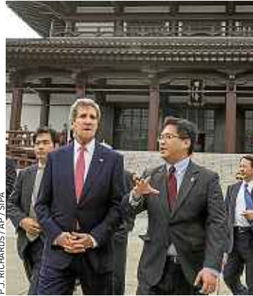
John Kerry a terminé sa tournée asiatique par le Japon, dimanche.