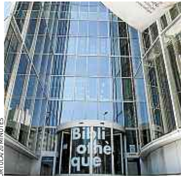
La structure était fermée partiellement depuis septembre.

« Dans les aménagements, on a mis l'accent sur une plus grande fonctionnalité et un plus grand confort », explique Dominique Ducassou, adjoint au maire chargé de la culture. Des escalators desservent les étages, l'acoustique a été refaite et les sièges changés. La municipalité a aussi installé un studio de répétition pour les pratiques ama-